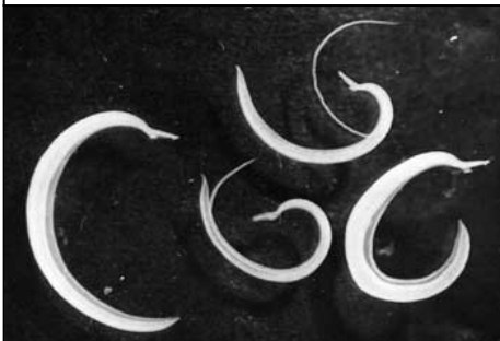
دودة خيطية = البلهارسيا Schistosoma intercalatum