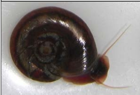
حلزون Biomphalaria glabrata