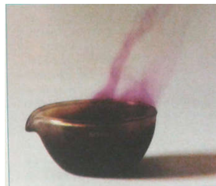
Fig. 4. Réaction entre le diiode et l'aluminium. On mélange du diiode I_2 (pilé dans un mortier) et de l'aluminium en poudre. La réaction se déclenche quand on ajoute quelques gouttes d'eau (catalyseur) ; elle forme du triiodure d'aluminium AlI_3 . Le dégagement de chaleur provoque l'apparition d'un nuage violet de diiode.