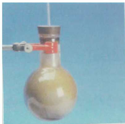
Fig. 2. Réaction entre le dichlore et l'aluminium. Le ballon contient du dichlore (gaz) et de l'aluminium en poudre. Quand on chauffe, l'aluminium réagit vivement avec le dichlore. On obtient du trichlorure d'aluminium AlCl_3