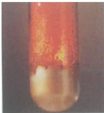
Fig. 3. Réaction entre le dibrome et l'aluminium. On laisse tomber quelques gouttes de dibrome liquide Br_2 sur de l'aluminium en poudre ; on observe alors de vives incandescences. Il y a formation de tribromure d'aluminium AlBr_3