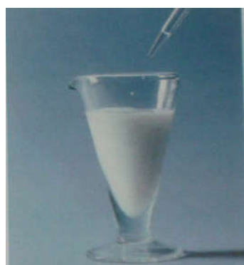
Fig. 5. Précipité de chlorure d'argent AgCl

▪ L'expérience montre que les dihalogènes Cl_2 , Br_2 , et I_2 réagissent vivement avec l'aluminium métal (figure 2, 3 et 4) pour former les trihalogénures d'aluminium AlCl_3 , AlBr_3 et AlI_3 .