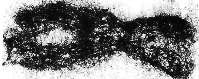
لاحظ بنية الصبغي الاستوائي.

الصبغة الصبغية: تعبر عن عدد الصبغيات وهي ميزة نوعية قد يرمز لها ب 2n أو ب n (أحادية أو ثنائية). الهستون: مكون من مكونات الخييطات النووية وهو عبارة عن بروتين يرتبط به خييط ADN ليعطي مظهر عقد اللؤلؤ للخييط.