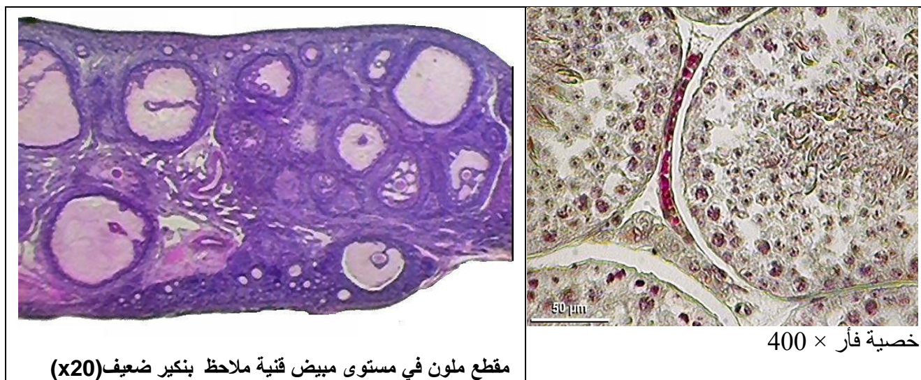
مقطع ملون في مستوى مبيض قنية ملاحظ بنكير ضعيف (x20)