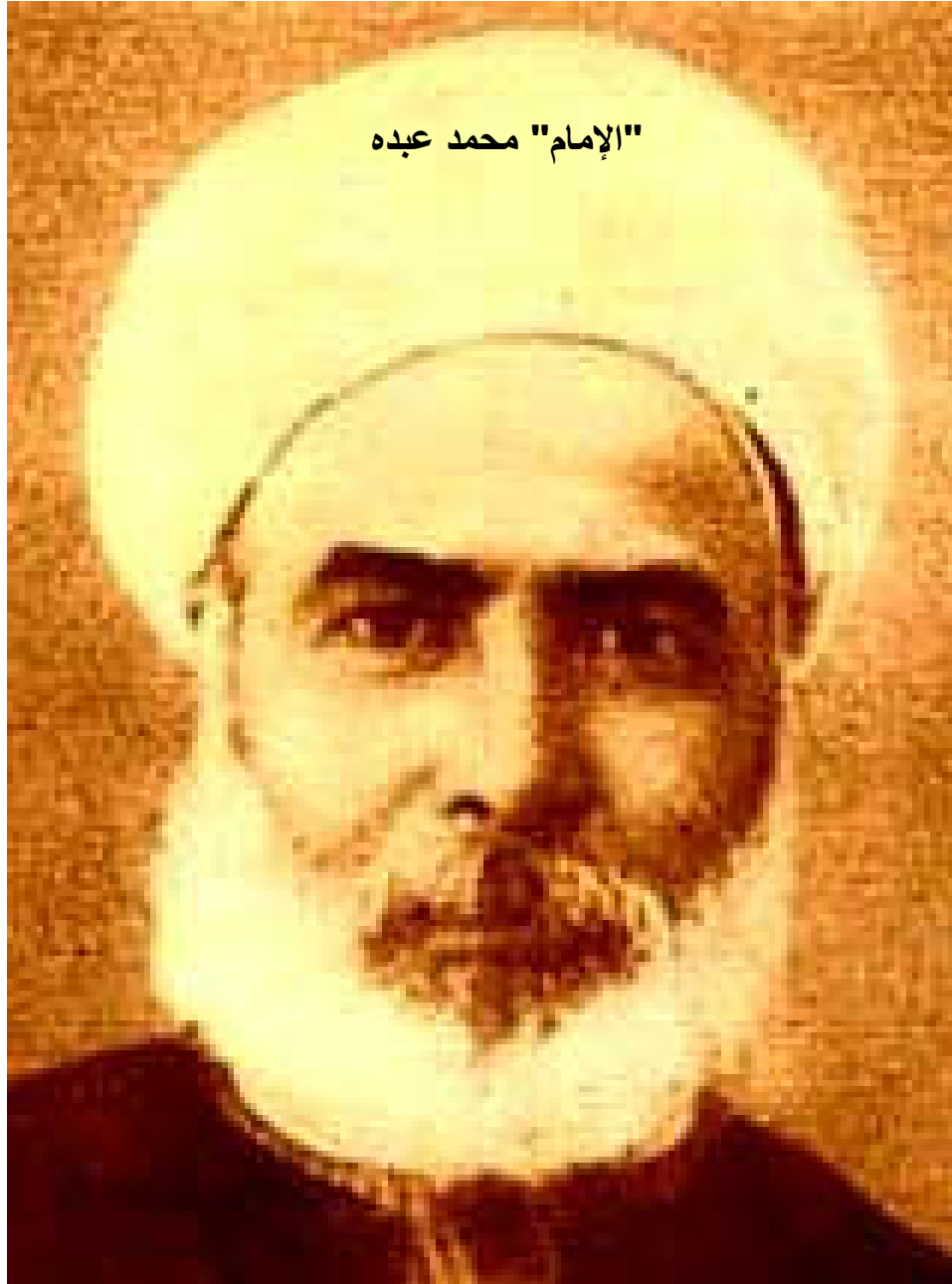
"الإمام" محمد عبده

ولد محمد بن عبده بن حسن خير الله سنة 1266 هـ الموافق 1849 في قرية محلة نصر بمركز شبراخيت في محافظة البحيره . في سنة 1866 التحق بالجامع الأزهر ، وفي سنة 1877 حصل على الشهادة العالمية، وفي سنة 1879 عمل مدرساً للتاريخ في مدرسة دار العلوم وفي سنة 1882 اشترك في ثورة أحمد عرابي ضد الإنجليز، وبعد فشل الثورة حكم عليه بالسجن ثم بالنفي إلى بيروت لمدة ثلاث سنوات، وسافر بدعوة من أستاذه جمال الدين الأفغاني إلى باريس سنة 1884، وأسس صحيفة العروة الوثقى ، وفي سنة 1885 غادر باريس إلى بيروت ، وفي ذات العام أسس جمعية سرية بذات الاسم، العروة الوثقى . توفي الشيخ بالإسكندرية بعد معاناة من مرض السرطان عن سبع وخمسين سنة، ودفن بالقاهرة يوم 11 يوليو عام 1905.