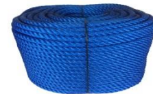
Corde en polyéthylène (PE)