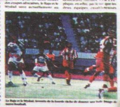
Le Raja et le Wydad, tenants de la Coupe du Trône, se sont affrontés hier à l'occasion de la demi-finale de la Coupe du Trône de football.