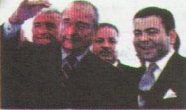
S.A.R. le Prince Moulay Rachid et le Président français Jacques Chirac visitent le port de Tanger-Méditerranée.