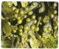
Alge : Fucus