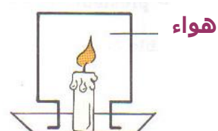
احتراق الشمعة في الهواء