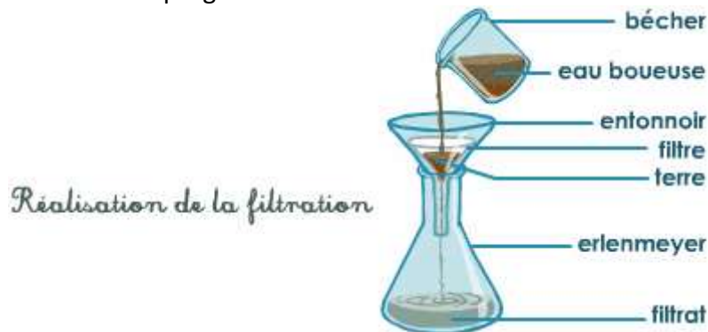
Doc. 3. Principe de la filtration.

Le mélange à filtrer est versé progressivement dans le filtre :